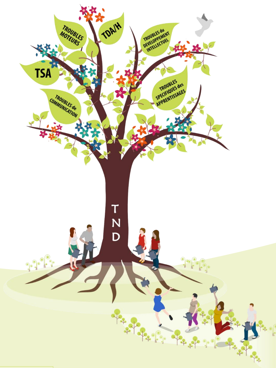
Table ronde « Agir sur mon parcours grâce à mon pouvoir d'agir »

10h00 > 11h30 | TABLE RONDE | Briscope – Salle de spectacle